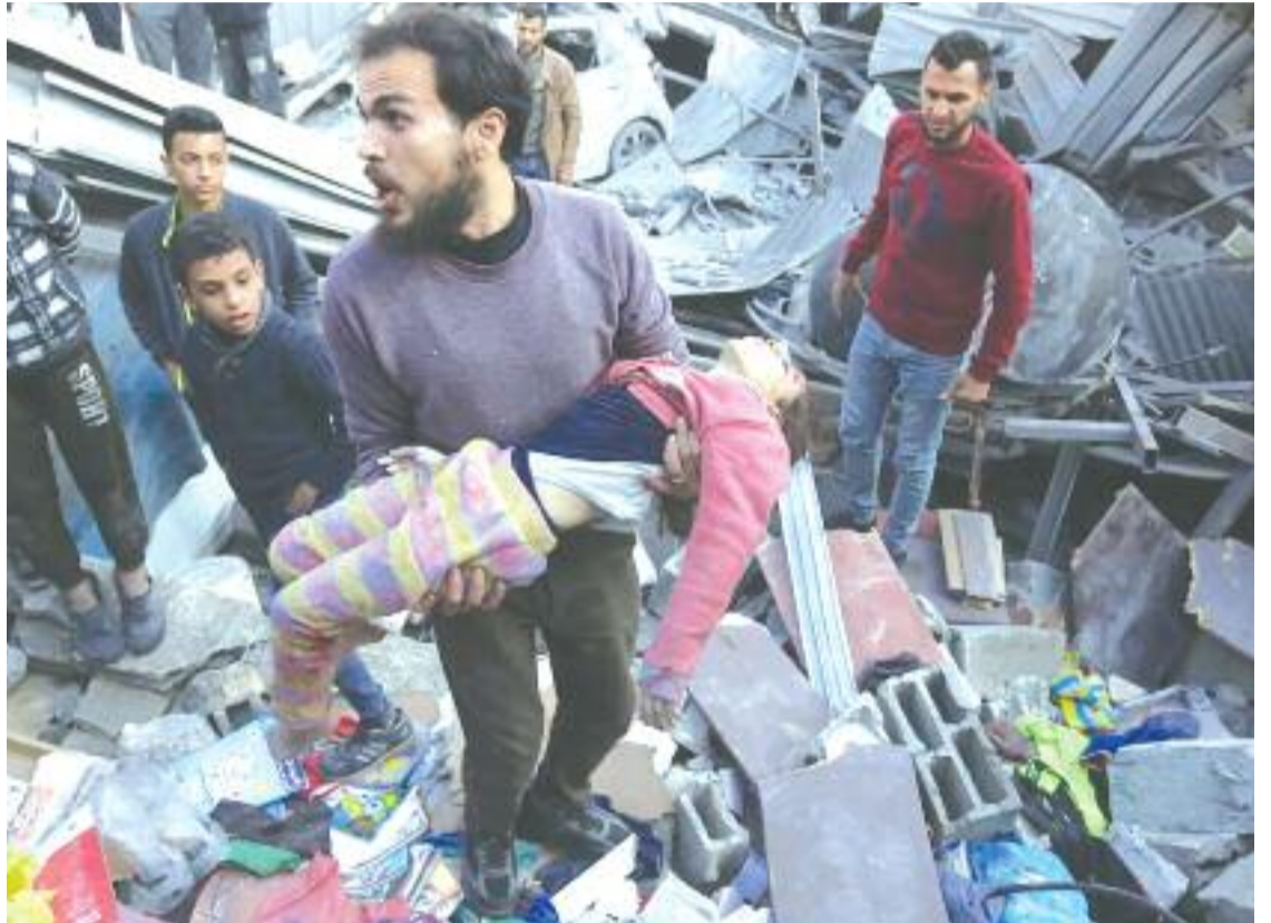
أخرى خلال الحرب.

سوى جهاز تصوير طبقي واحد بينما نحتاج عشرات".