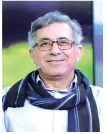
بقلم: حسن عبادي - حيفا