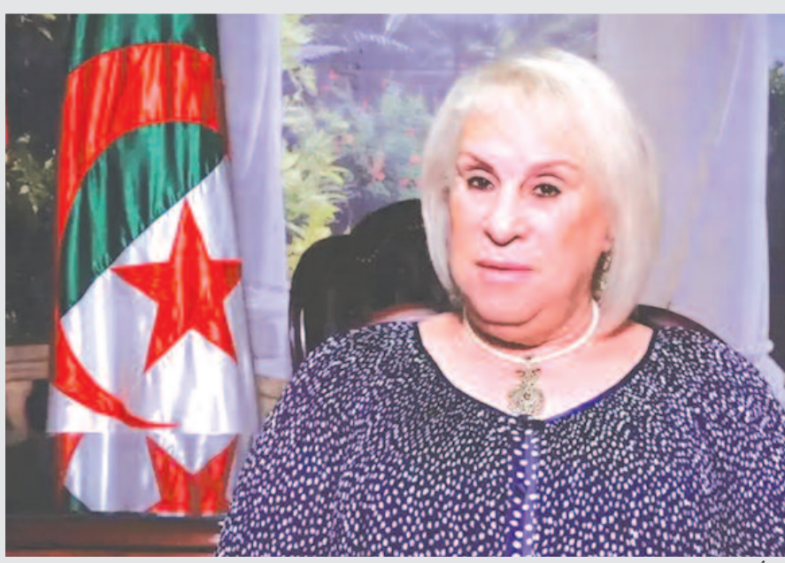
أول قبلة ذرية انفجرت بالجزائر قوتها 5 مرات قوة قبليتي هير وشيما وناكا زكي

■ صرح رئيس الجمهورية الفرنسي آنذاك فرانسوا هولوند، أربعة أيام بعد هذا اللقاء بأن «ما حدث في الجزائر هو تفجيرات نووية وليست تجارب نووية»، كان أول اعتراف سياسي لرئيس الجمهورية الفرنسية بأنها تفجيرات نووية ملوثة.. لدينا 14 طلب سنكشف عنها في الملتقى الذي سينظم بقران، والذي تحدثت عنه سابقاً.