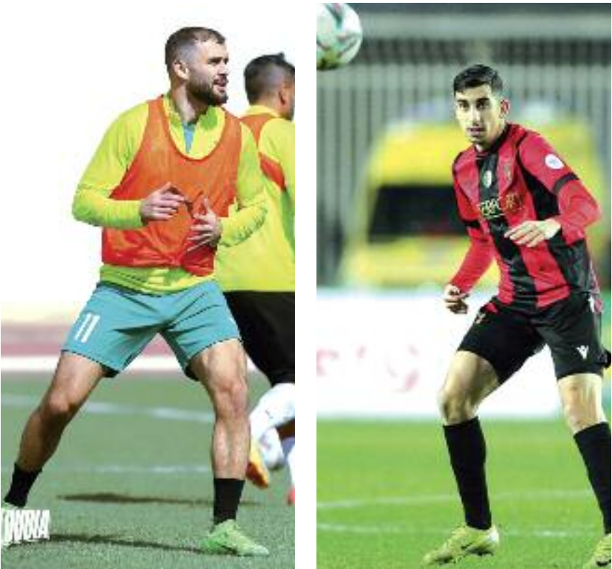
تصيط عقارب الساعة غدا الجمعة على الداربي العاصمي، الذي يستقبل فيه فريق اتحاد العاصمة ضيفه مولودية الجزائر، يلعب 5 جويلية الأولي بداية من الساعة 18:00 مساء، لحساب تسوية رزنامة الجولة السابعة من بطولة الرابطة الجزائر الأولى، في مواجهة الخطف فيها ممنوع للفريقين الباحثين عن إنهاء مرحلة الذهاب بطلا شتويا.