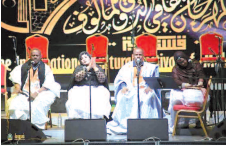
في ختام المهرجان الثقافي الدولي 12