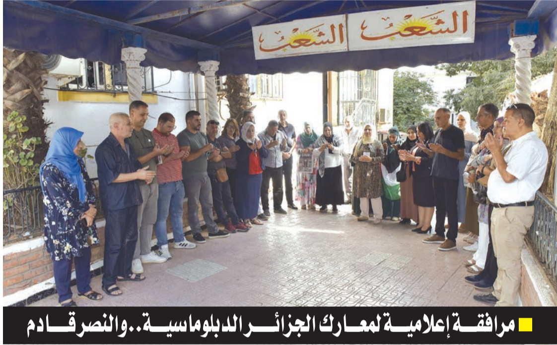
مرافقة إعلامية لمعارك الجزائر الدبلوماسية.. والنصر قادم

نظم، أمس الاثنين، صحفيو ومستخدمو مؤسسة «الشعب»، بمقرها المركزي، وقفة تضامنية مع الشعب الفلسطيني الشقيق وقضيته المقدسة، وذلك بمناسبة الذكرى الأولى لـ «طوفان الأقصى»، وعام من حرب الإبادة والجريمة ضد الإنسانية التي يقترفها الكيان الصهيوني ضد الفلسطينيين. بعد الوقوف دقيقة صمت وترجم على شهداء وأبطال الصمود الفلسطيني، وقراءة الفاتحة على أرواحهم الطاهرة الزكية، حمل أبناء «أم الجرائد» أعدادا من جريدة «الشعب»، التي تصدرت صفحاتها الأولى مواضيع وملفات خضت أم القضايا بالتحليل والدعم والمراقبة الدبلوماسية والسياسية والإنسانية. وعبر صحفيون ومستخدمون، عن دعمهم المطلق لقضية فلسطين، التي تبقى قضية الجزائر، التي كانت ومازالت وستبقى مع فلسطين ظالمة أو مظلومة، مثلما أكدها الرئيس الراحل هواري بومدين، وأكد عليها رئيس الجمهورية عبد المجيد تبون بأن الجزائر لم ولن تتخلى عن فلسطين إلى الأبد. وأفردت، أمس، جريدة «الشعب» القضية الفلسطينية بملف واسع وهام، حيث تضمن العدد حوارات مع رئيس مجلس الأمة المجاهد صالح قوجيل، والسفير الفلسطيني فايز أبويعطة، والمتحدث باسم بلدية غزة، إلى جانب تصريحات خبراء ودبلوماسيين وأساتذة ومثقفين ورياضيين، جددوا دعمهم للامشروط لقضية كل العرب والمسلمين وأحرار العالم، حتى القيام الكلي والنهائي لدولة فلسطين المستقلة. وقد راقت مؤسسة «الشعب» لحظة بلحظة،