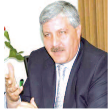
بقلم : المتوكل طه

إنّ توحيش التحالف المسعور الصهيوني الأمريكي، الممتد من رفح إلى بيروت، مروراً بالضفة، هو فضيحة العصر، ولا مكان للقاتل بين الأمم. وستبقى هذه المذابح حاضرة في وعي البشرية وعلى أسنة البشر، ولن تنطفئ جمراتها قريباً. وإنّ وحدة الساحات وحدها ما سيحقق الثبات للمقاومين، ويحول دون تحقيق الكيان الصهيوني لأهدافه الإجرامية، بمعنى أنّ غزّة أشرت، منذ اللحظة الأولى، إلى منظومة مقاومة على العديد من الساحات والجهات (لبنان واليمن والعراق ومن خلفها)، وثبات غزّة ومساندة المقاومة اللبنانية، سيمنع الاحتلال من إبادة الضفة، وتهجير غزّة، وتصفية القضية الفلسطينية..