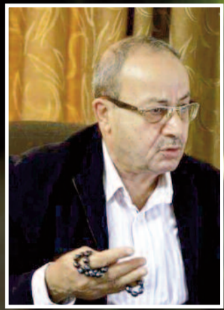
بقلم: د. فيصل أبوشهلا