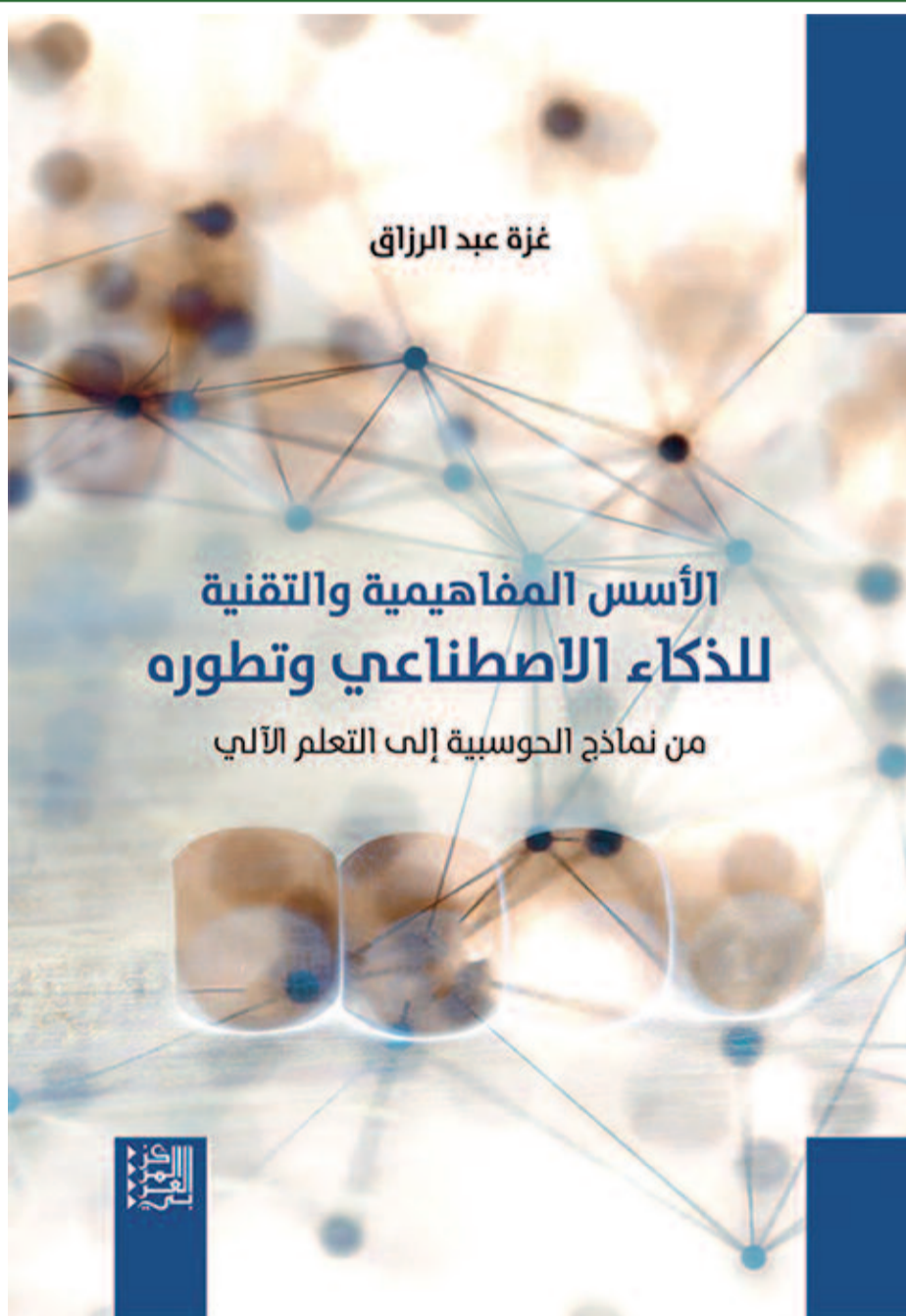
غزوة عبد الرزاق

بناءً عليه، انطلق رواد الموجة الأولى من الذكاء الاصطناعي بفرضية أنّه "تمكن محاكاة أيّ نشاط إنساني بدقة بواسطة آلة". وهي موجة استمرت حتى السبعينيات، عندما بدأ الاسترشاد بالأنشطة البشرية في مجالات المعلوماتية، ومنه انطلقت الموجة الثانية من الذكاء