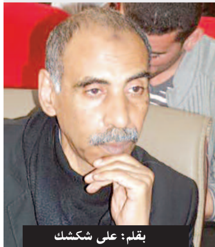
بقلم: علي شكشك

بالوداعة الكاملة التي - على العكس من ذلك - قد تكون مفتاحه إلى ضمير البشر والصفحات المطوية في تلافيف الإحساس، وتماها كما كان المسيح هو الذي حمل حواريه وتعاليمه إلى آخر البر ومصبات الأنهار، فقد تكون الحالة الفلسطينية هي العالم الجديد وبقا المشهد الآتي الذي سيغير وجه العالم ويهزم إمبراطوريات الظلم والحديد، والمشهد الكوني متعطش لهذا القادم الجديد، فهو بما لديه من رصير إنساني فطري وبما يعانيه من عذابات القوى التي تصليه كل حين وتحجب عنه المال والسماء، هو جاهز لاستقبال الوليد الجديد.. بمجرد الإشارة استقبل البشارة واعترف بفلسطين وزاد بالتلهليل متحدثاً إرادات البطش وتهديدات الوعيد والتمويل، وما كان انتصار فلسطين في اليونسكو إلا انتصار هذه الإنسانية التي تكاد تولد من جديد، معجزة أخرى.. فلسطين ليست فقط مولوداً ولكنها أيضاً قابلة هذا العالم الجديد.