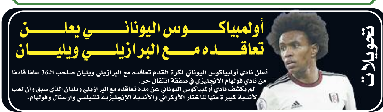
أعلن نادي أولمبيكوس اليوناني لكرة القدم تعاقد مع البرازيلي ويليان صاحب الـ36 عاما قادما من نادي فولهام الإنجليزي في صفقة انتقال حر. لم يكشف نادي أولمبيكوس اليوناني عن مدة تعاقد مع البرازيلي ويليان الذي سبق وأن لعب لنادية كبيرة منها شاختار الأوكراني والأندية الإنجليزية تشيلسي وارسنال وفولهام.

تسعى رياضة الجيدو الجزائرية لفئاة المعاقين بصريا، خلال مشاركتها السادسة على التوالي في الألعاب البارالمبية (باريس 2024)، إلى تحقيق التميز وتأكيد سيطرتها على هذا الاختصاص إفرقيًا، بعد ميداليات أسيينا (2004)، وبكين (2008)، ولندن (2012)، وريو (2016)، وطوكيو (2021). من أجل تحقيق هذا الهدف، تبقى الأمل معلقة على المصارعين المتأهلين للموعد البارالمبي، إسحاق ولد فويدر (فئة أقل من 60 كلغ/ تصنيف 1)، وعبد القادر بوعامر (فئة أقل من 60 كلغ/ تصنيف 1)، وسوفان تقتصر مهمة هذين الرياضيين في الدفاع على مكانة الجيدو البارالمبي الجزائري فحسب، بل كذلك السعي إلى المصود على منصة التتويج. ويحتل ولد فويدر، الذي يسجل مشاركته الثانية في الألعاب البارالمبية، المركز العالمي في فئة سيطر عليها بطال العالم الأوزيكي تاموزوف شيرزود، متبوعا بالوكرائي دافيد خوراهنا والوورجوجي زوراب زورابيان. وعن حظوظ العناصر الوطنية، أكدت مدربة المنتخب الوطني مونييا كركاز: «إن المنافسة في