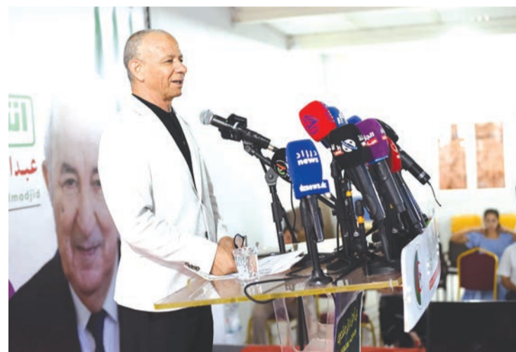
بداية الحملة الانتخابية من أجل مشاركة من جهة أخرى، حيث رئيس حركة البناء المرأة المناضلة التي قامت بواجبها منذ قوية في الاقتراع».