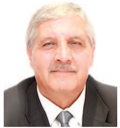
ثمة إنسان يكاد يرمي أوراقه للريح، ويمضي ليغير العتمة، ويسدل الستار على فصل موجع، قوامه أن الشاعر أنهى دوره، وذهب إلى العدم! هكذا دون مقدمات واضحة ومبررة، وهكذا يرى البعض نهاية الشعراء مع الألفية الثالثة.

والشعر ابن الخوف والتضرع والتأمل، وابن النزعات والرغبات والخلجات الأولى. والعالم يدخل مرحلة الشيخوخة، والشعر فتى، يبقى، وما بعده يزول. ففي العالم أشياء قديمة لا تزول.. وعزائنا أن الإنسان رغم كل هذه الحديدية وهذه البرمجة المتقنة حتى الفرع، والوباء والتلوث والجنزات.. سيظل بحاجة ماسة، لشهقة موسيقى وخمّة ريشة، وكلمة تضوّع الحياة بأريجها المستحيل.