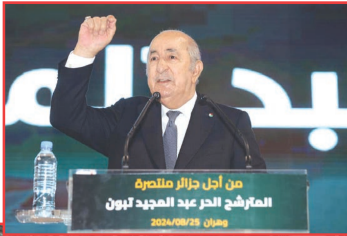
من أجل جازلر ملاصرة المرشح الحر عبد المجيد تبون وهران 2024/08/25

■ أعرف أنكم تنتظرون الكثير.. ومن حقكم وسأعمل على تحقيق ما تطلبونه ■ استحداث 450 ألف منصب شغل جديدة وزيادة الأجور والمنح والرواتب