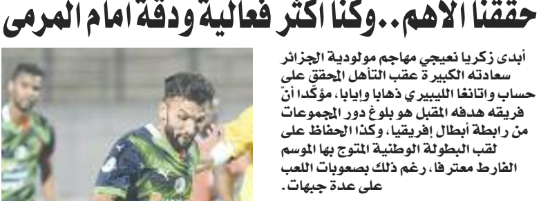
حاوره: عزيز – ب

الشعب، حققتهم الأهم بالتأهل للدور التمهيدي الثاني لرابطة أبطال إفريقيا.. ما تملقذك؟