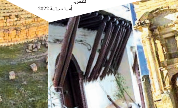
أما سنة 2022،