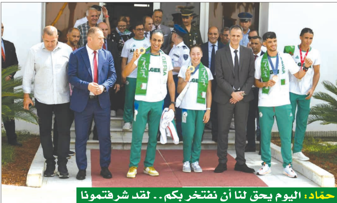
حماد: اليوم يحق لنا أن نفتخر بكم.. لقد شرفتمونا

وأكد على أن القارة الإفريقية «عانت بشكل كبير من هذا الواقع المؤلم والمتمثل الذي يفرض نفسه، خصوصا في منطقة الساحل الصحراوي». كما ذكر في ذات السياق ب«العانة المستمرة التي يعيشها شعب إقليم الصحراء الغربية المستعمر منذ أكثر من 50 عاما وكذلك ما يعيشه أشقاؤنا الفلسطينيين من مأساة حقيقية تتفاقم يوما بعد يوم وحرب الإبادة التي تشنها سلطات الاحتلال على الشعب الفلسطيني منذ أكثر من 10 أشهر على التوالي بسبب عجز مجلس الأمن عن ردع المحتل الإسرائيلي عن جرائمه». وأعرب مقرران عن «قناعة الجزائر بحاجة مجلس الأمن لليوم للوقوف الإفريقي؛ صوت الحكمة وصوت الالتزام وصوت المسؤولية، مذكرا بالموقف الإفريقي الذي يركز على المبادئ التي تتم تحديدها في «توافق إيزلوبيني» و«إعلان سرت» اللذين يعتبران الإطار المرجعي الأساسي والوحيد.