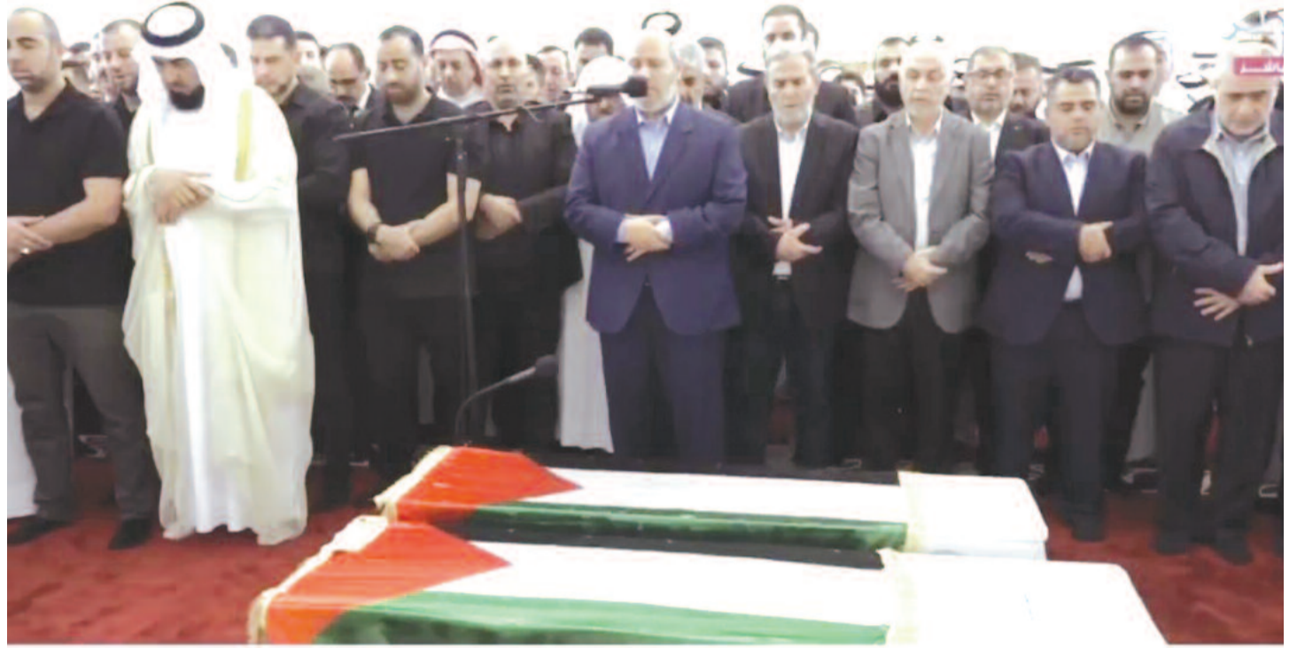
تشيع جنازة إسماعيل هنية رئيس المكتب السياسي لحركة حماس ومرافقه في جامع الإمام محمد بن عبد الوهاب

بحضور رسمي وشعبي كبير، تم أمس بالعاصمة القطرية الدوحة، تشييع رئيس المكتب السياسي لحركة حماس، إسماعيل هنية، الذي تعرض للاغتيال الأربعاء الماضي رفقة أحد حراسه في مقر إقامته بطهران، غداة مشاركته في حفل تنصيب الرئيس الإيراني مسعود بزشكيان. ووري رئيس المكتب السياسي لحركة المقاومة الإسلامية (حماس) الشهيد إسماعيل هنية الثرى في قطر، أمس الجمعة، بعد جنازة شعبية ورسمية شهدت حضور مسؤولين من دول عربية وإسلامية.