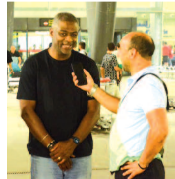
اللاعبين وحتى مع المسيرين.

سعيد مرة أخرى بتواجدي في الجزائر وكما قلت لكم سابقا، سأسعى لأكون عند حسن ظن مسؤولي نادي اتلتيك بارادو وشكرا.