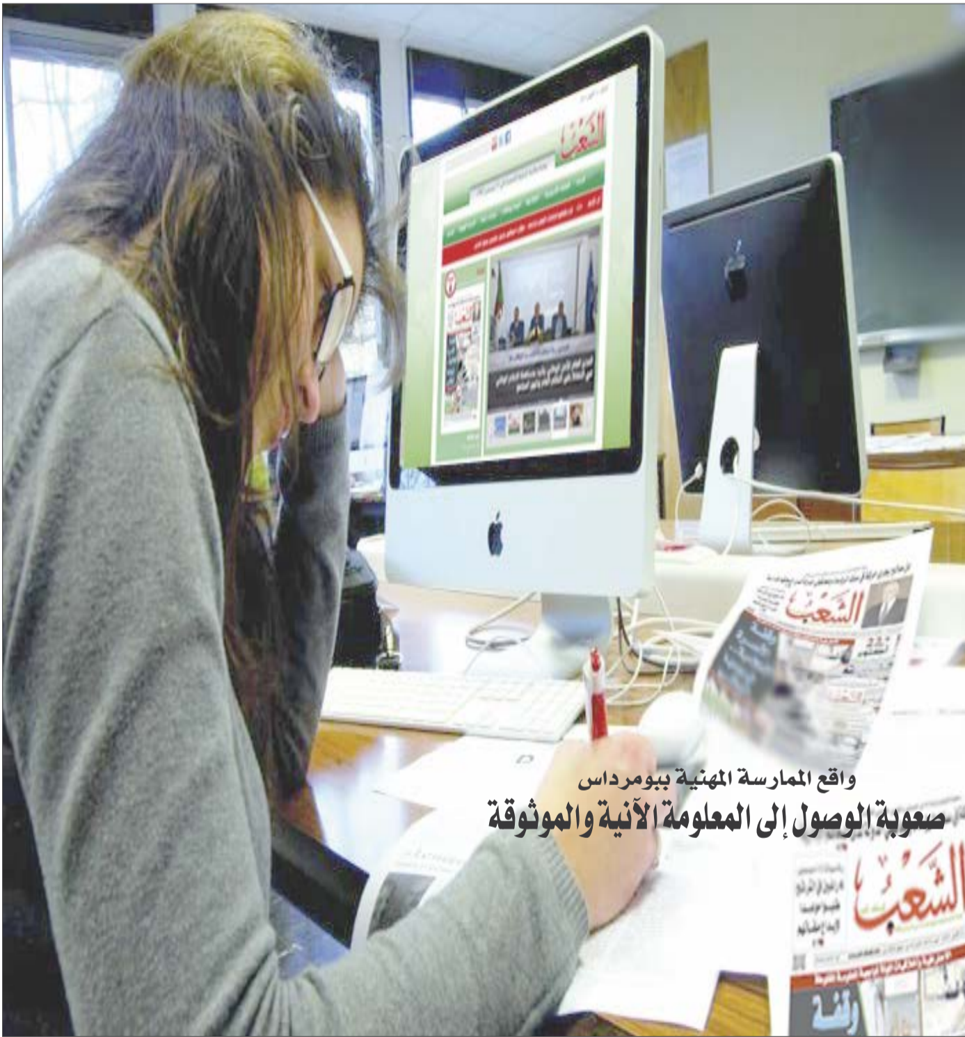
واقع الممارسة المهنية بيوم دراسي صعوبة الوصول إلى المعلومة الآنية والموثوقة