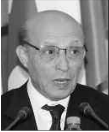
الاقتصادي بين البلدين الذي شكل فرصة لسعادة السفير.

الشعب / استقبال رئيس المجلس الشعبي الوطني العربي ولد خليفة، أمس، سفير المملكة المتحدة لبريطانيا العظمى وإيرلندا الشمالية لدى الجزائر، أندرو نوبل، بمقر المجلس.