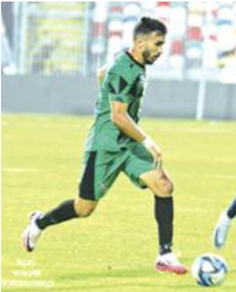
للمرة الخامسة على التوالي.

يسعى نادي اتحاد جدة السعودي القديم، للتعاقد مع الدولي البرتغالي دانييلو بيريرا، خلال فترة الانتقالات الصيفية الجارية، حسب تقارير صحفية أمس الأربعاء. يسعى الإتحاد للتعاقد مع العديد من الصفقات المميزة خلال الميركاتو الصيفي الجاري، بعدما ضم عدة عناصر يأتي على رأسها الجزائري حسام عوار. ويحسب ما ذكرته صحيفة "بولسا" البرتغالية، فإن إدارة نادي اتحاد جدة وضعت في منكرتها البرتغالي دانييلو بيريرا، لاعب باريس سان جرمان، لتدعيم وسط ميدانها قبل بداية الموسم الجديد. وأوضحت أن "دانييلو يمكن أن ينضم لاتحاد جدة، بعد فشل عودته لناديه السابق بورتو البرتغالي، بسبب المطالب المالية المرتفعة من باريس سان جيرمان، والتي وصلت إلى 10 ملايين يورو". ويرتبط دانييلو بعقد مع باريس سان جيرمان يمتد حتى صيف 2025، مما يدفع ناديه للاستفادة ماليا من رحيله قبل نهاية العقد.