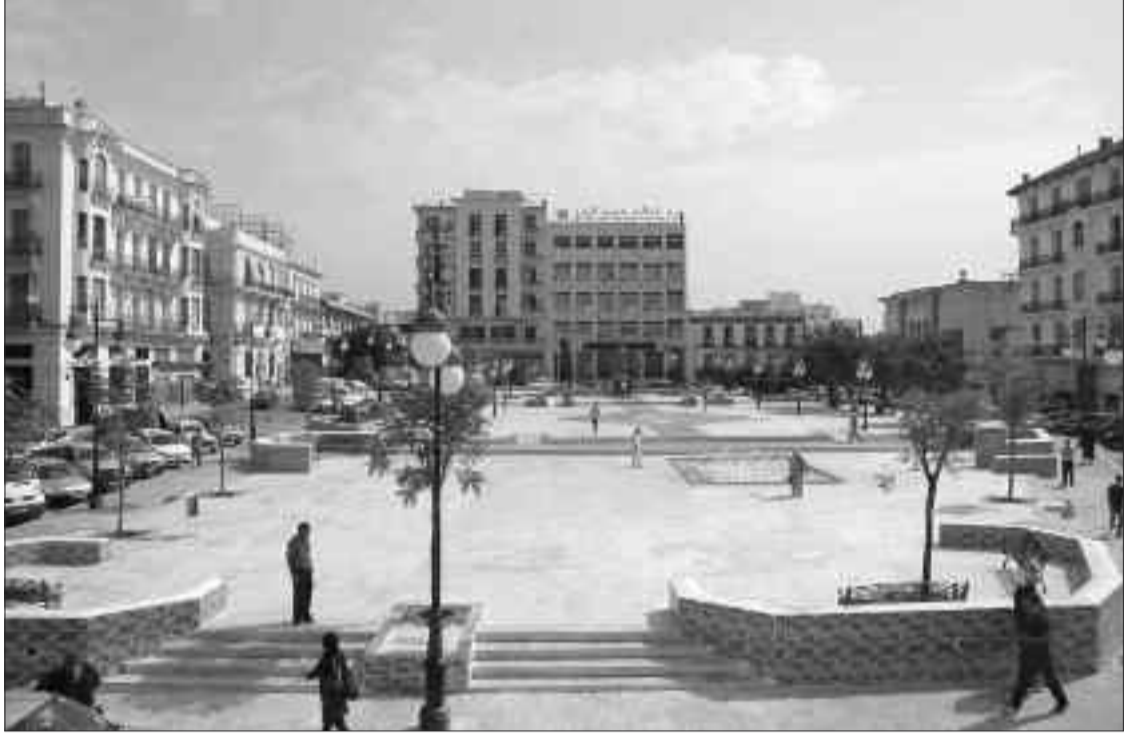
معسكر: أم الخير.س

أمر والي معسكر أولاد صالح زيتوني، كل من مصالح الصحة والأطراف الفاعلة في اللجنة الولائية لمكافحة الأمراض المنتقلة عبر المياه كل حسب مهامه، بفتح تحقيق معمق في ارتفاع عدد الإصابات بمرض التهاب الكبد الوبائي بمنطقة تيغنيف وضواحيها، حيث تموقع 26 حالة من أصل 53 إصابة مسجلة خلال السداسي الأول من السنة الجارية، بالمنطقة الجغرافية نفسها التي تحصي شهريا إصابات مماثلة ومتفاوتة بالمرض.