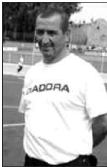
على أرضنا وأمام جمهورنا..