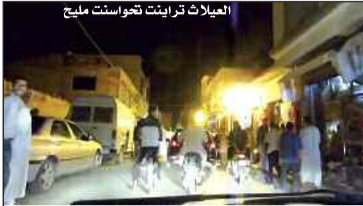
العيلات تراينت تحواسنت مليح

انسرس جار ني فاسن انكم كل اس نالسبت اغميس نتمازيغت..ماني اتافم لخبار تتمورثنا اس ووالن يلان نسنين اق غورن سكل، اشنويث، امزابيث، اقباليث، اشاويث، اتراقيث..الشيياي يلان هيقيث "الشعب" مانك اتيلي سما او ازاث ان كل نوقراي..الهدف انغ ننا اعذال نالشي يلان يتراق اق جرنان "الشعب"، و انتشني نترحب سالخطوات انيغ لرياي ني قران نوجرنان مانك اتحسن.