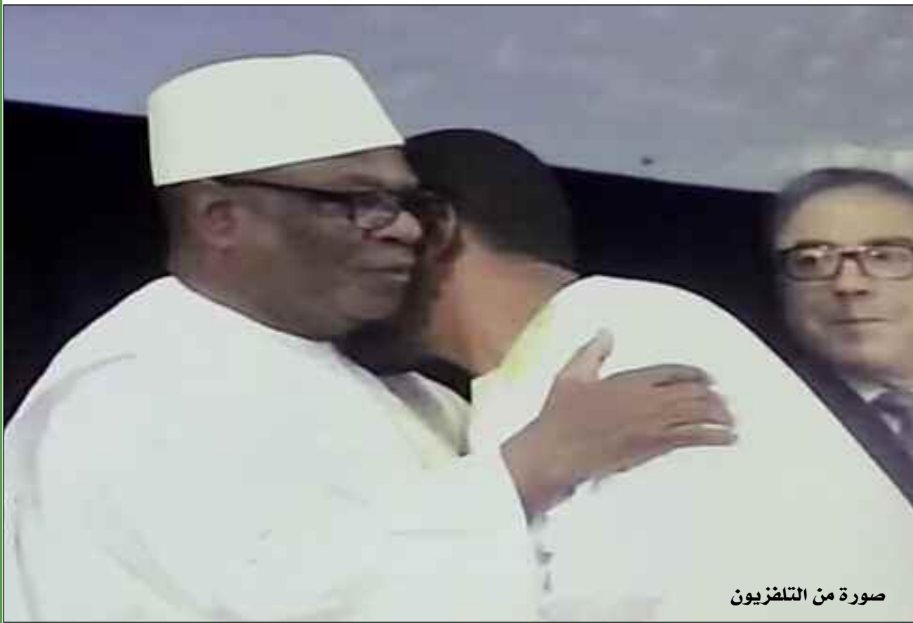
صورة من التلفزيون

وزيرنا للخارجية: الحدث التاريخي يسمح بعودة الأمن إلى شمال مالي