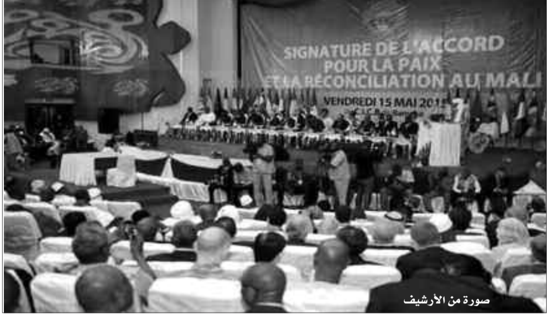
صورة من الأرشيف

استقبل الرئيس المالي إبراهيم أوبوكر كاييتا، مساء أمس الأول، بيمباكو، وزير الدولة وزير الشؤون الخارجية والتعاون الدولي رمضان لعمامرة الذي نقل رسالة شفوية من رئيس الجمهورية عبد العزيز بوتفليقة، إلى رئيس جمهورية مالي بحضور رئيس الدبلوماسية المالية عبدولاي ديوب.